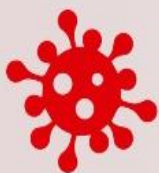
Mapa da evolução dos casos de coronavírus por bairro